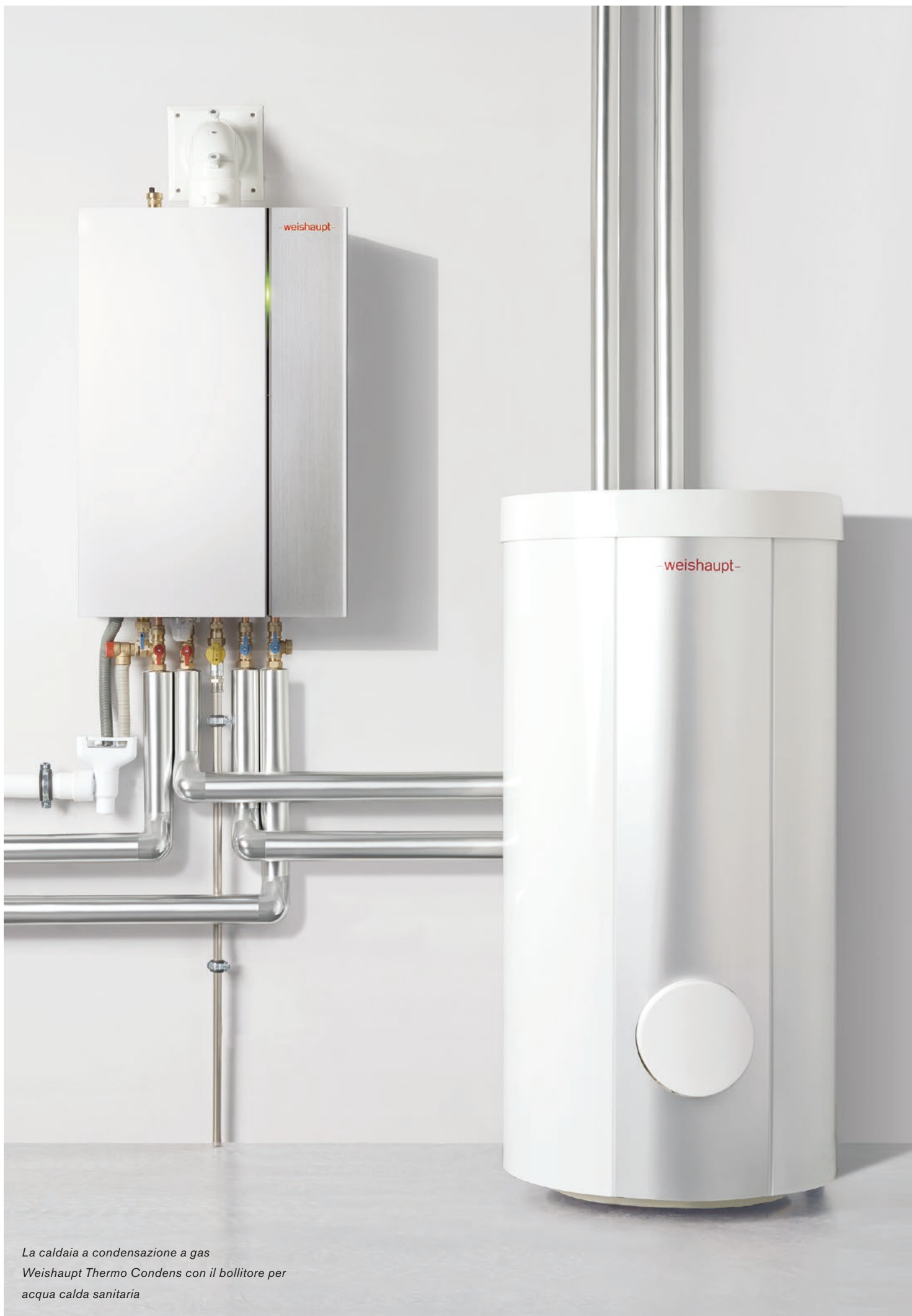
La caldaia a condensazione a gas Weishaupt Thermo Condens con il bollitore per acqua calda sanitaria