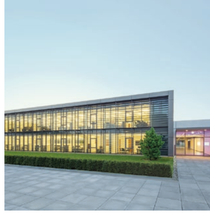
Centro di ricerche e sviluppo