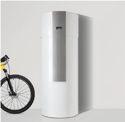
Utilizzo del calore dell'aria con bassi costi di installazione: bollitore acqua calda sanitaria in pompa di calore