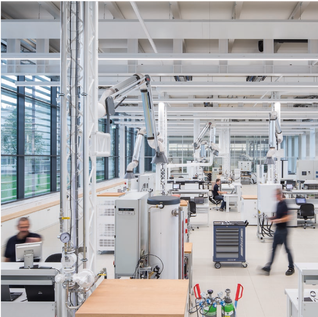
Banchi di prova per sistemi di riscaldamento